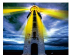
灯塔与光芒 寓意“理想的光芒”